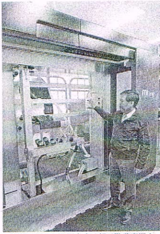
搾乳ロボットを紹介する想田酪農事業本部長(北海道千歳市)

給餌機、バンコンソフトなどを組み合わせたつなぎ飼いの牛舎向けの精密飼養管理システムで、一頭、頭の乳量に応じて最適な量の餌を与える。牛の能力を最大限