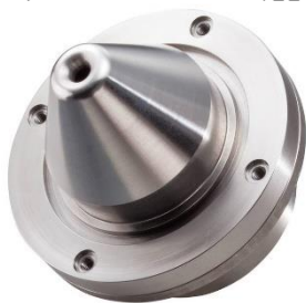
[ NBG-Y05 ]